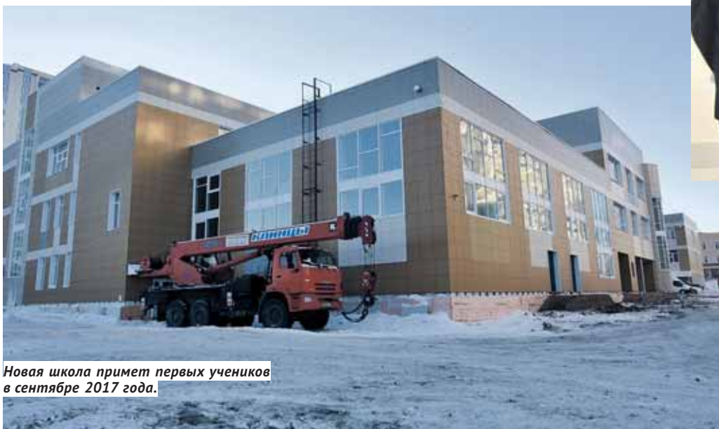
Новая школа примет первых учеников в сентябре 2017 года.

Г лава области посетил строительные площадки школ в микрорайоне Берёзовый в Первомайском районе и на Ключ-Камышенском плато в Октябрьском районе Новосибирска. Говоря о школе № 213 «Открытие» в Берёзовом, глава региона напомнил, что её запуск позволит разгрузить другие школы микрорайона — № 117 и № 141, а также частично гимназию № 8, в которых сегодня переизбыток учащихся. Школа в Берёзовом строится по федеральной программе «Жилище», с софинансированием из федерального и регионального бюджетов. Ориентировочная сметная стоимость объекта составляет 450 млн рублей. Строительная готовность здания на 10 марта практически по всем показателям оценивается выше 90%.