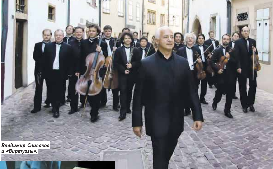
Владимир Спиваков и «Виртуозы».