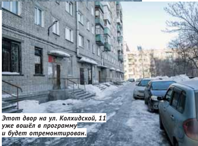
Этот двор на ул. Колхидской, 11 уже вошёл в программу и будет отремонтирован.

Благоустройство многих дворов в городах всё ещё оставляет желать лучшего. Новосибирск в этом плане не исключение. Несмотря на то что по различным программам на благоустройство придомовых территорий выделяются значительные средства, на все нуждающиеся в этом дворы их, как правило, не хватает. Именно поэтому партия «Единая Россия» организовала проект «Городская среда» и начала сбор предложений от жителей по благоустройству дворов. Думская фракция партии инициировала выделение на эти цели 20 миллиардов рублей из федерального бюджета для 72 регионов. 450 миллионов из этих средств приходится на Новосибирскую область. Ещё 250 с лишним миллионов рублей на реализацию программы даст областной бюджет. Самое важное в этом проекте то, что решать, какие дворы и каким образом благоустроить, будут сами жители. Для этого «Единая Россия» проводит сбор заявок и предложений от горожан, общественных организаций, управляющих компаний — словом, всех, кому небезразлична судьба своего двора.