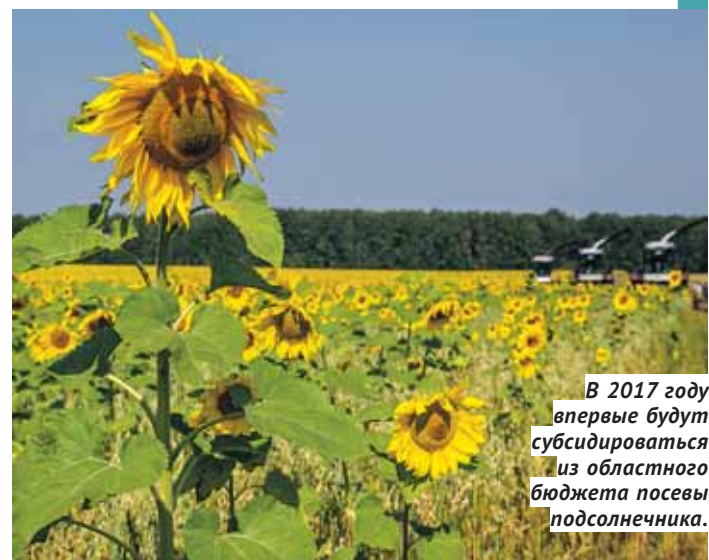
В 2017 году впервые будут субсидироваться из областного бюджета посевы подсолнечника.

Также в этом году впервые будут субсидироваться из областного бюджета посевы технических культур — подсолнечника, рапса, льна. Новшество весьма актуально, потому что впервые за много лет аграрии не только Новосибирской области, но и всей страны столкнулись с определёнными проблемами при реализации излишек пшеницы. Диверсификация посевного клина позволит хозяйствам не зависеть только от главной культуры, цены и спроса на неё, а зарабатывать на том, что востре-