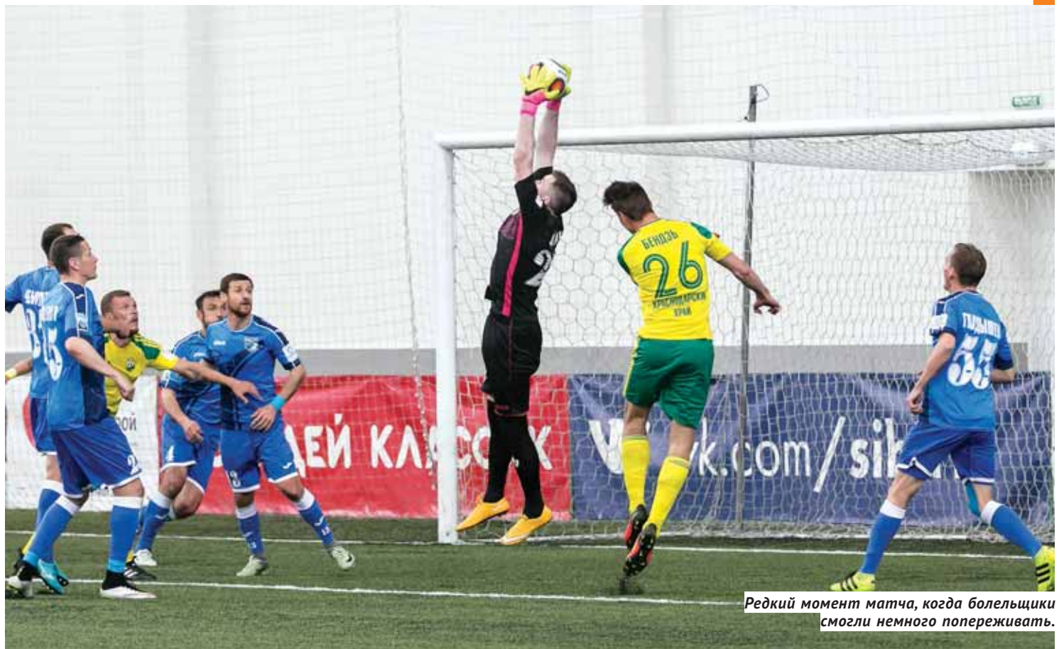
Редкий момент матча, когда болельщики смогли немного попереживать.

После зимнего перерыва в Новосибирск вернулся большой футбол, но не принёс радости болельщикам.