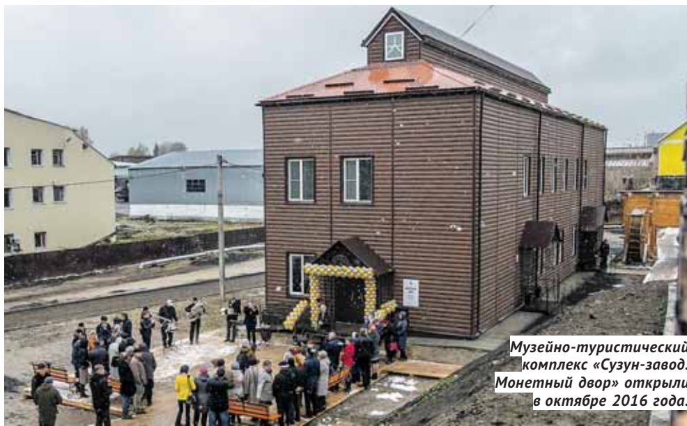
Музейно-туристический комплекс «Сузун-завод. Монетный двор» открыли в октябре 2016 года.

Р азработка проекта закона Новосибирской области «Об отдельных вопросах развития туризма» продиктована рядом обстоятельств. Ныне действующему закону уже более 10 лет, а с 1 января 2017 года вступил в силу и новый федеральный закон. Разработанный региональный закон преследует цель не только «приведения в соответствие», но и актуализации отрасли под современные реалии.