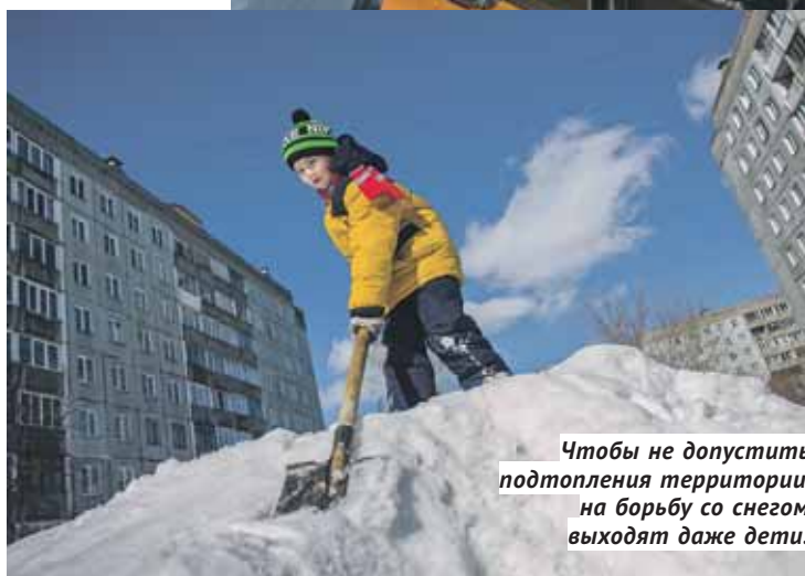
Чтобы не допустить подтопления территории, на борьбу со снегом выходят даже дети.

ной работы водозабора в Новосибирске. Так как температура не позволяет ледяному покрову формироваться на Оби, приходится осуществлять большой пропуск воды. Сейчас приток составляет 462 кубометра в секунду, сброс — 983 кубометра в секунду, с 15 марта пропуски в нижний бьеф увеличены до тысячи кубометров в секунду. Это обусловлено необходимостью поддерживать минимальный график сработки и максимально благоприятные отметки в нижнем бьефе для безаварий-